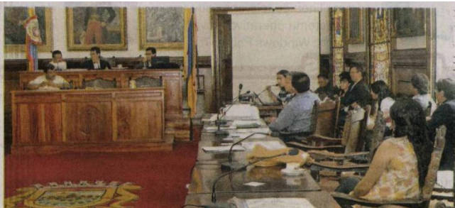
Ayer en las Instalaciones del Concejo Municipal se llevó a cabo el primer debate público sobre el proyecto de reforma a la Ley 30 de 1992.

Por último, y en medio del rechazo de los asistentes, reiteró el llamado a la comunidad estudiantil para que continúe con el debate, pero de forma pacífica y para que retomen las clases, teniendo en cuenta que los más perjudicados son quienes desean terminar su periodo académico sin complicaciones: «En las instituciones públicas estudian 550.000 jóvenes y más del 50 por ciento provienen de familias pobres. El perjuicio es para los estudiantes que no quieren atrasarse, que se quieren graduar para salir al mercado laboral a conseguir un empleo digno para ellos y sus familias», y recordó que cada día de paro en las universi-