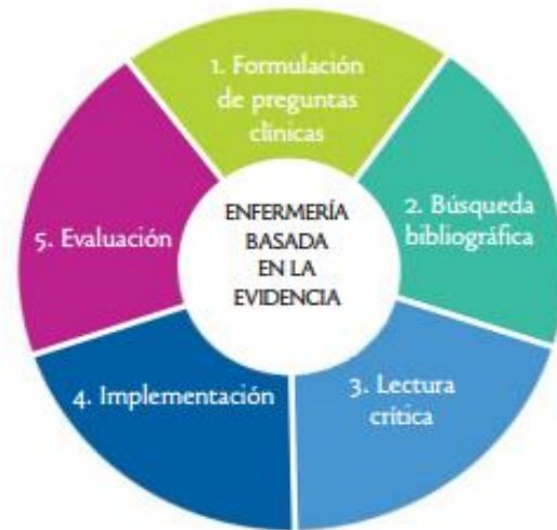
Figura 1. Fases de la EBE (Coello et al., 2004)