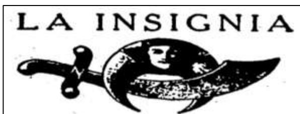
Imagen 20. "La Insignia" grafo usado por La Defensa y El Siglo para simbolizar a Turbay y su condición peyorativa de "Turco".

Entre más cercano el momento decisivo de las elecciones más necesario enfatizar todos los argumentos que había esgrimido el conservatismo contra los candidatos contrarios a la Unión Nacional, comunismo, fraude, violencia, sectarismo, y desde luego raza, el más importante, no el único, de los argumentos de los opositores de Turbay, incluyendo a Gaitán.