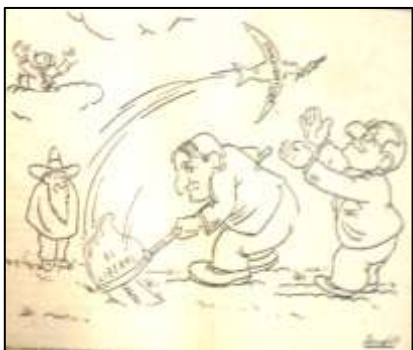
El Siglo. 28 de marzo de 1946. p. 4

esta táctica rendirá frutos cuando el conservatismo decida luchar desde sus filas y no apoyando a candidatos liberales, pero eso lo veremos más adelante. En resumen la estrategia del conservatismo intentará mostrar la candidatura liberal derrotada desde el principio, superada por una disidencia no oficial, y atrapada entre las rencillas de sus líderes “oligarcas” López, Lozano, Echandia y compañía.