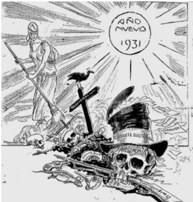
Imagen 1. Caricatura de Rendón. El Tiempo. 1 de enero de 1930

Desde el siglo XIX los conservadores no habían sentido la amargura que sentían en 1930, casi una generación completa había disfrutado de las mieles de la hegemonía, pese a la guerra de inicios de siglo XX y que habían ganado. Los liberales, por su parte, prometían desde los discursos en los estrados que el gobierno del nuevo presidente Olaya Herrera sería un gobierno de Concentración Nacional, donde primaría el bien de la nación por encima de todo, incluso de los partidos, era supuestamente necesaria la modernización en medio de un ambiente económico pesimista al que ya poco le quedaba del esplendor de la Danza de los Millones. Sin embargo, pese al mensaje positivo de todo mandatario en su posesión o a los nombramientos de