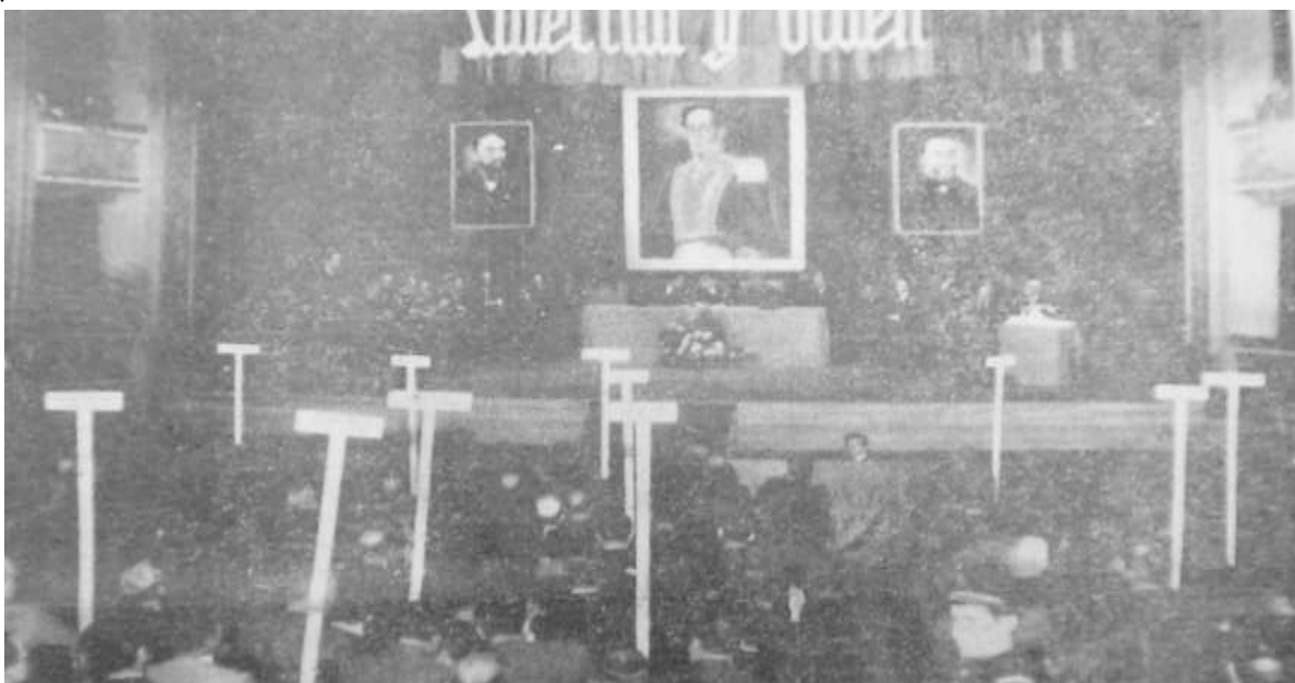
Imagen 10. Interior del Teatro Colon en la Convención Conservadora, dominado por las imagenes de Núñez, Bolivar y Caro. El Siglo. 24 de marzo de 1946. p. 1