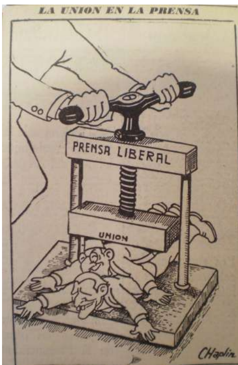
Imagen 16. Caricatura de Chaplin en la que mofa de los intentos de unión del liberalismo, amparados por la "prensa liberal". El Siglo. 15 de abril de 1946. p. 4

división, a sus jefes locales entregándose, y a un conservatismo con un candidato que no daba la pelea sino que prometía paz. Ahora bien hay que tener en cuenta que tipo de difusión tendrían esta clase de mensajes en las bases del liberalismo, o si solo los intelectuales se atrevían a escudriñar las páginas de los periódicos del enemigo. Si fuese así no hay duda que a partir de rumores los mensajes se esparcían en los lugares de encuentro de la población. El 27 de abril, a ocho días de las elecciones La Patria, en su editorial denominado “Liquidación” 449 , analizaba uno por uno a los candidatos del liberalismo, junto con cualquier oposición a Ospina, a quienes situaba en un caos “El observador menos sagaz [...] se da cuenta de que el liberalismo, izquierdismo y sindicalismo han sido puestos en liquidación” concluye sobre la confusión.