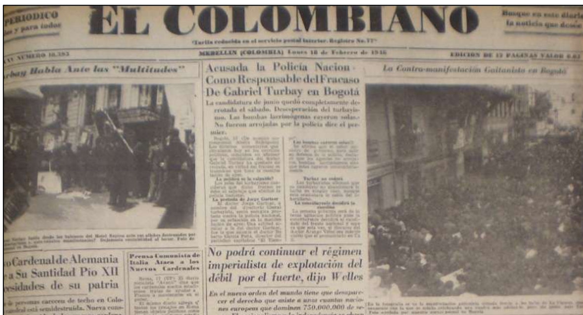
Imagen 5. Portada de El Siglo. 18 de febrero de 1946. Se puede apreciar el manejo de la información para que pueda ser digerida por el lector de manera compacta, estando en la misma pagina, de manera enfrentada, la información de las dos manifestaciones.

Por otra parte La Patria, en su editorial, preveía la llegada de Turbay a Bogotá en un ambiente de cierta reticencia al turbayismo, lo que mostraba que el “hombre que escalar a las más alta posición del país, no tiene la confianza ni siquiera en el pueblo de la capital” 237 y agrega “El señor Turbay ha gastado dos años de su vida en predicar a los cuatro vientos y cuando se acerca el término de la jornada encuentra una creciente indiferencia y una total decepción publica” 238 . Por ultimo La Defensa desde Medellín, titulaba "Prohibido cantar el himno nacional para no agravar al candidato turco" 239 , haciendo referencia a que la manifestación en Bogotá tendría un carácter antinacional.