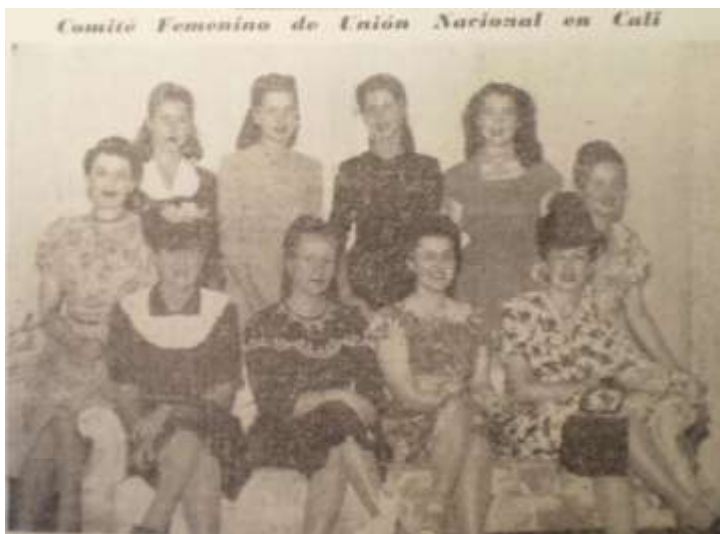
Imagen 14. "Comité femenino de la Unión Nacional en Cali". El Siglo. 10 de abril de 1946. p. 10

verdades eternas” y añade “lo único que importa en las próximas elecciones es librar la batalla contra el fraude y el tumulto”, que, como veremos unas líneas adelante, resumirá a Turbay y a Gaitán.