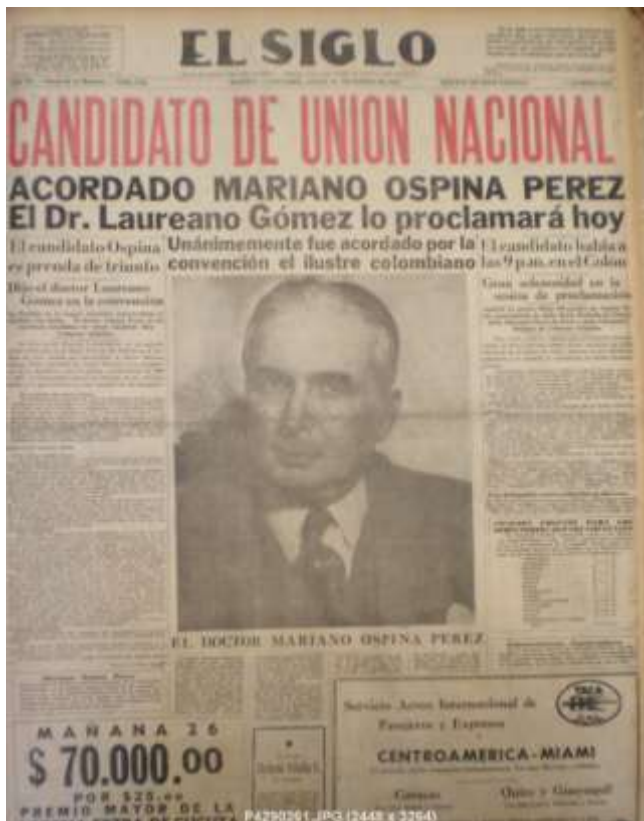
Imagen 11. El Siglo. 25 de marzo de 1946. p.1

La convención fue un evento digno del conservatismo, con toda una parafernalia simbólica se apoderó del Teatro Colón, imágenes de Bolívar, de Caro y de Núñez gobernaban la congregación, en el público se divisaban las diferentes delegaciones de los departamentos. Debió haber sido un ambiente de fuerza y de hermandad el que se sintió en el teatro, una especie de sentimiento de renovación, de re-regeneración ( Imagen 10 ).