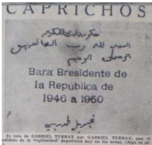
Imagen 22. Caprichos. Supuesto voto de Turbay por el mismo, notese la burla de el lenguaje y la caligrafía. El Siglo. 5 de mayo de 1946. p. 5

Paradójicamente el editorial plantea el miedo y la desconfianza y halaga paralelamente el ambiente democrático que ha impulsado Lleras Camargo. En la página siguiente la viñeta Caprichos reproduce el “El voto de GABRIEL TURBAY por GABRIEL TURBAY que el candidato de la ‘legitimidad’ depositará hoy en las urnas (Algo es algo)” (Imagen 22).