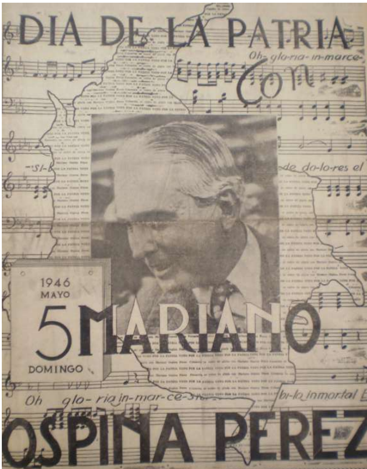
Imagen 23. Contraportada de La Defensa y El Colombiano el 5 de mayo de 1946.