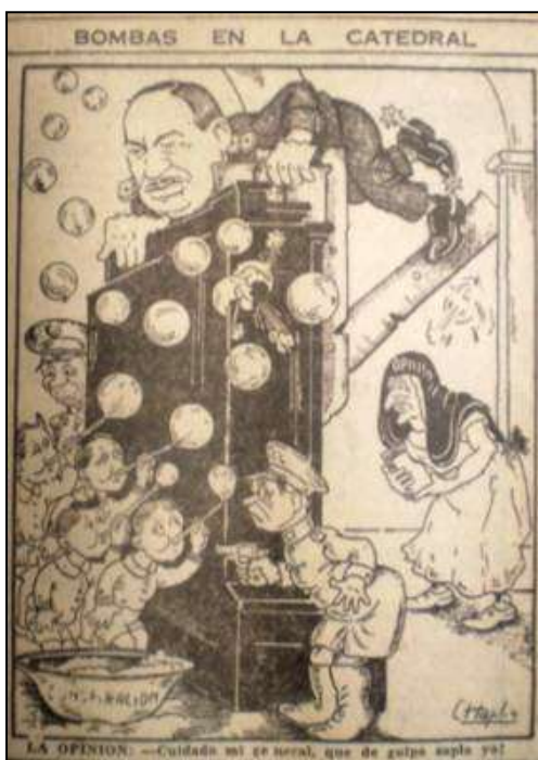
Imagen 2. Caricatura de Chaplin sobre las bombas de la Catedral. El Siglo. 13 de marzo de 1945. p. 4

arrestando a los sacerdotes violaba, según la prensa conservadora, dicho pacto. Lo que según El Siglo había causado indignación en toda la ciudad, calificando siempre los hechos como persecución por parte de los detectives del Estado, persecución que no solo se ejercía en Bogotá, sino en toda la nación. El “desorden” era para Laureano Gómez producto de un desorden moral antes que material, y el responsable no era otro que López, según su Editorial del día lunes; “cuando en un país el desorden moral tiene caracteres tan vastos y horripilantes, no se puede esperar sino que sobrevenga el desorden material” 198 .