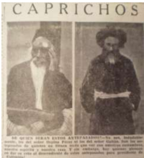
Imagen 21. Caprichos. mofa sobre los ancestros de Turbay. El Siglo. 4 de mayo de 1946. p. 5

Para el fin de semana de las elecciones los diarios estaban más que preparados, varias plumas celebres habían sido recopiladas y harían parte de la edición del sábado y el domingo, junto con un arsenal de titulares, notas, comentarios y frases que habían hecho parte de la campaña y que ahora debían volver a circular para recordar los factores que durante la campaña los diarios, de la mano de los políticos e intelectuales conservadores, habían construido.