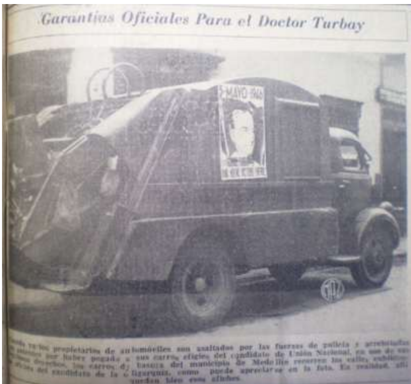
Imagen 17. Fotografía con la que El Colombiano denunciaba el uso de carros oficiales para hacer campaña a Turbay en Medellín. EL Colombiano. 13 de abril de 1946. p. 1

Es probable que los incesantes rumores e informaciones que fomentaba la prensa conservadora en diferentes regiones del país hallan hecho eco en los organismos de control, si esta hubiese sido la situación el conservatismo se sentía respaldado en su lucha contra el fraude cada vez que el presidente o en este caso la Procuraduría emitiera comunicados sobre el fraude y sus consecuencias. Así titulaba a seis columnas El Siglo : “Se castigará implacablemente a los delincuentes electorales, afirma el Procurador” 476 y seguía con el caso de Boyacá, a propósito de lo dicho por el procurador, en el editorial “El fraude en Boyacá” 477 , donde se volvía a denunciar los rumores de fraude en el departamento señalando como directo responsable al gobernador García Ulloa.