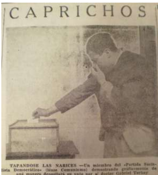
Imagen 18. Comunista votando por Turbay. El Siglo. 18 de abril de 1946. p. 5