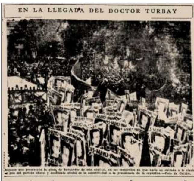
Imagen 6. Fotografía de la manifestación turbayista en Bogotá. El Tiempo. 17 de febrero de 1946. pp. 1

Sabotaje a la propaganda gaitanista" 241 , el solo titular ya tiene más de una advertencia, una sevicia del turbayismo contra el lopismo, despertar el miedo por las manifestaciones de Turbay y la defensa del gaitanismo frente al candidato oficial del liberalismo, pues según el corresponsal, la propaganda de Gaitán estaba siendo "misteriosamente retirada" y agrega basándose en rumores que "se comenta en los círculos de esta capital, que el tubayismo no tiene oradores competentes ni jefes prestantes" mostrando una cierta incompetencia logística del turbayismo que más que eventual era estructural 242 . El día lunes, después de la llegada y el recibimiento de Turbay en Bogotá El Colombiano publica una fotografía a tres columnas de unas contadas personas frente al Hotel Regina, y el pie de foto ironiza la imagen "Gabriel Turbay habla (...) antes sus afiches destrozados por los antiturbayistas y ante cuantos manifestantes?" y en la misma página, al lado derecho, se publica la "contramanifestación" del gaitanismo en Bogotá "En la foto se ve la manifestación gaitanista situada