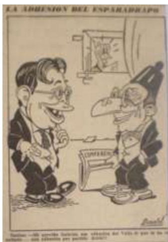
Imagen 8. Caricatura de Donald mofandocé de los hechos de Cali. El Siglo. 17 de marzo de 1946. p. 4

Como ya vimos se repite la caracterización del turbayismo como poco masculino, como “llorón” y como un contendiente no digno incluso contra la violencia del gaitanismo al que terminaran admirando de ha pocos.