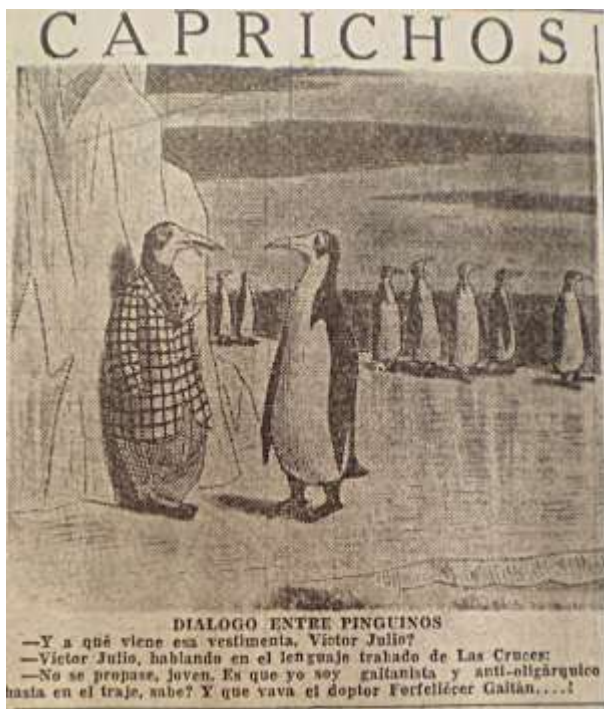
Imagen 13. Viñeta Caprichos sobre el nuevo lenguaje del gaitanismo. El Siglo. 6 de abril de 1946. p. 5

liberal y su candidato legítimo a la presidencia de la republica!” pegándole un manotazo a la mesa a lo que Gaitán respondió: “-Pues eso lo veremos en las plazas públicas” 427 .