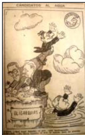
El Siglo. 25 de marzo de 1945. p. 4

Caricatura de Donald, muestra a Echandia intentando atrapar la candidatura (la paloma) con el gorro frigio, dejándola libre para un Turbay que igual no la alcanza.