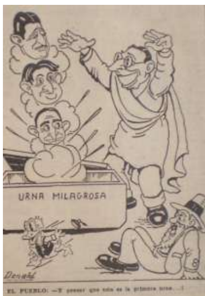
Imagen 9. Caricatura de Donald "La Urna Milagrosa". El Siglo. 10 de marzo de 1946. p. 4

Ya a comienzos de marzo la reunión era un hecho, se da por sentada la fecha del 23 de marzo, un domingo, un día propicio para una fiesta política. Si bien hasta esas fechas aun apoyaban la posibilidad de un frente nacional, como lo anunciaban en sendos titulares: “El conservatismo colombiano prohija toda política de unión nacional, en cuanto signifique la conjugación de distintas fuerzas de la opinión pública” 350 , la idea empezaba a entrar en desuso.