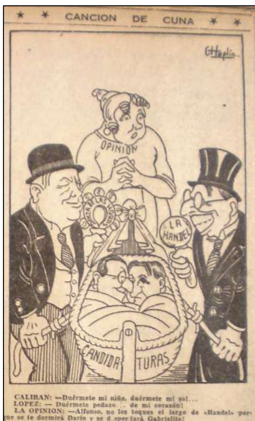
Imagen 3. Caricatura de Chaplin. El Siglo . 1 de marzo de 1945. p. 4

toda costa” 225 , y es innegable que desde la renuncia de López el partido liberal no tenía una sola cabeza visible que lo condujera.