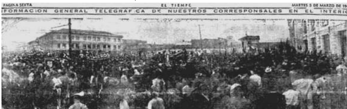
Imagen 7. Fotografía de la “verdadera” manifestación del Turbay. El Tiempo. 4 de marzo de 1946. p. 3.