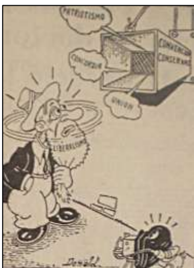
Imagen 12. Caricatura de Donald. El Siglo. 25 de marzo de 1946.p. 4

Volviendo a El Siglo del 25 de marzo, su editorial se titulaba: “La república de Colombia” 368 , donde, como era de esperarse, Laureano Gómez se despachaba en elogios a la Convención, de la que resalta que no hubo el más mínimo asomo de sectarismo pues el encuentro se caracterizó por el “elocuente despliegue de unidad y de fuerza” y agrega: “la patria estuvo allí, más que nunca, por encima de los partidos”. Después se personificará en Gómez todo este estoicismo que lo llevo a inmolarse en pos de Mariano Ospina Pérez. Como fuera la unidad del conservatismo, por lo menos de dientes para afuera, era total, y El Siglo se daba el lujo de echárselo en cara a los liberales, por medio de la caricatura de Donald aledaña al editorial de Gómez ( Imagen 12 ), en la que se les decía a los liberales (caracterizados como un viejo de barba larga y sombrero, un cacique entrado en desuso), acerca de las expresiones de unión que se escuchaban por un ducto de ventilación: “Aunque ud. No lo crea” 369 , y el liberalismo alegorizado se pregunta “en que país será eso?”, en la viñeta aparece Donald tomando la foto.