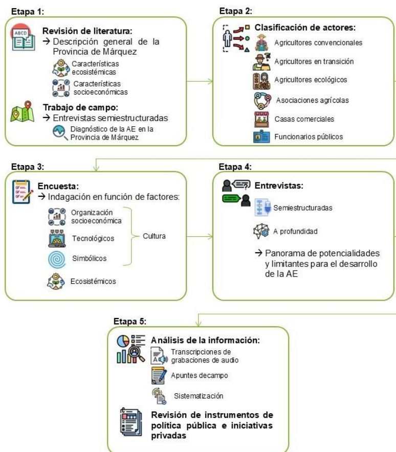
Figura 3-1. Etapas de la metodología de la investigación

La investigación se realizó en cinco etapas, como se muestra en la Fig. 3-1, las cuales tuvieron como fin común cumplir con el objetivo general de la investigación: analizar las relaciones de las potencialidades y limitaciones ambientales de los sistemas de agricultura ecológica en los municipios de Nuevo Colón y Turmequé, Boyacá.