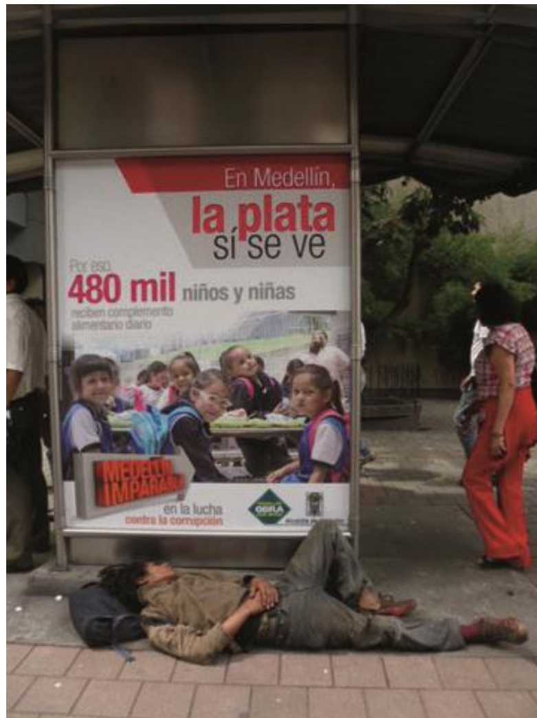
Figura # 3. Avenida Oriental. Medellín. Noviembre 2011.