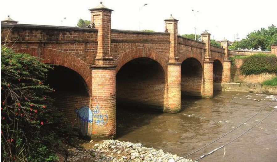
Figura # 8. La Plaga. Calle*30. Medellín. Enero 14, 2011.