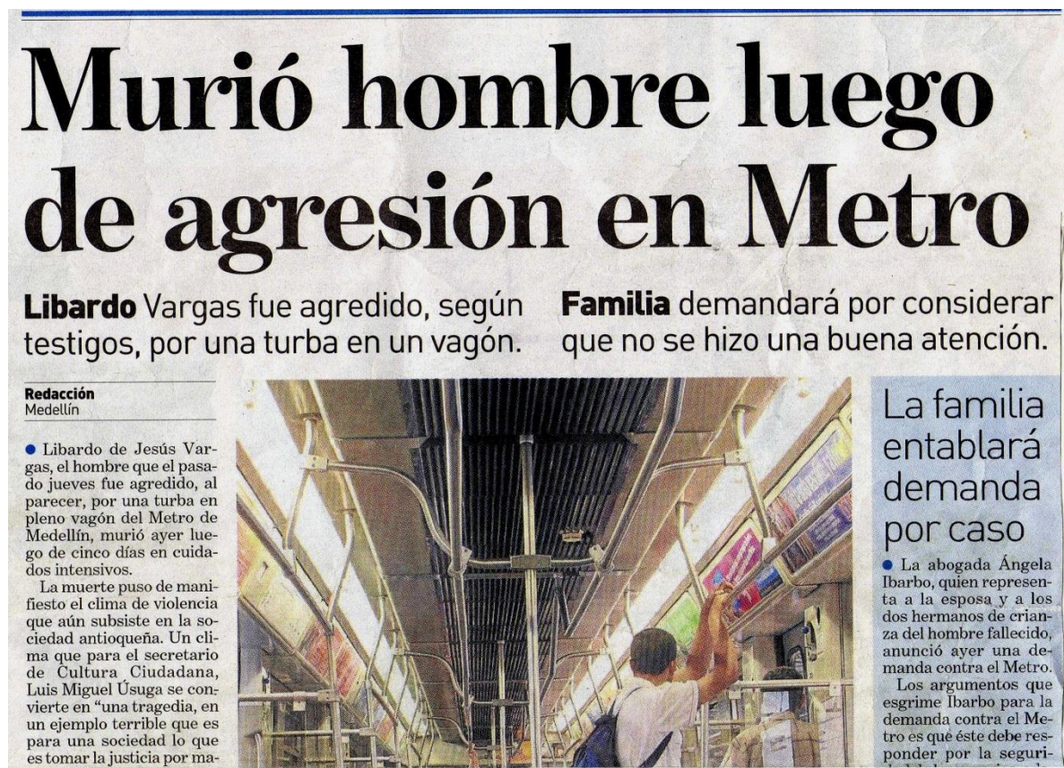
Figura # 5. Recorte de prensa. ADN, Diario. Medellín. Miércoles 7 de Septiembre de 2011. Año 2. # 721., p. 2

ciegos a todo lo que aconteció, por lo que de inmediato se ordenó mejorar la vigilancia e instalar cámaras al interior de los vagones para evitar situaciones como estas, además de otras malversaciones de la Cultura Metro que viene aconteciendo y donde uno de sus principales dispositivos: los usuarios mismos están fallando como mecanismo, mientras inician una apropiación más íntima y astuta, aunque altamente regulada, de este sistema de transporte, pero pasa por alto dado el nivel de ocultamiento de estas acciones en segmentos de viaje que escapan a la vigilancia.