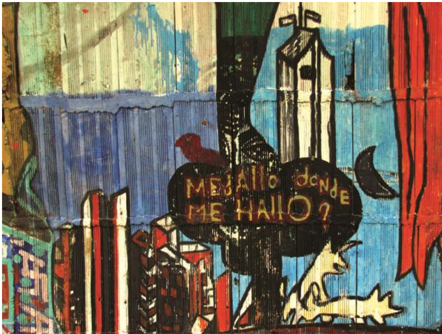
Figura # 4. Medallo donde me hallo? Por Daniel Panguana. La Capilla, Unal, Medellín.

arquitectos. Una construcción retórica y una apropiación discursiva de la ciudad desde las experiencias y prácticas cotidianas, sensibilidades urbanas.