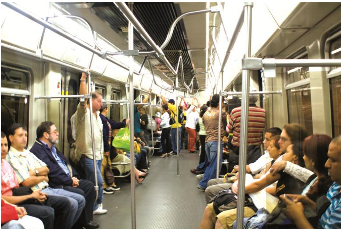
Figura # 6. Interior de un vagón del metro de Medellín.

Más allá de un cumplimiento ciego, o mejor, una interpretación rigurosa del guion cultura metro, lo que logro observar, como fenómenos en crecimiento, son ciertas fugas o escape al rigor disciplinario en el interior de las estaciones y vagones del metro practicas astutas, propias de la metis y las potencias de la mentira. Particularmente observamos como bajo la utilización de la mimesis, el camuflaje, disfraz, performática y en fin, a través de teatralidades, como tácticas, se burla el riguroso control en este espacio plagado de dispositivos de control escópico.