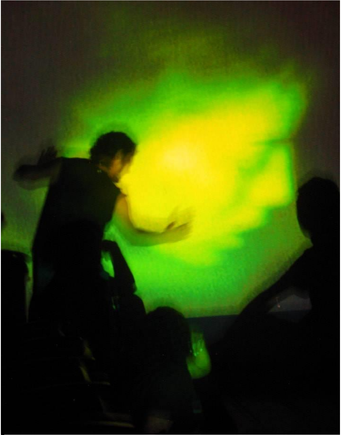
7 Imagen tomada Clase de taller, ejercicio realizado en el Auditorio Universidad Jorge Tadeo