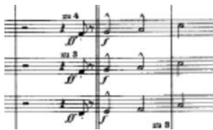
Motivo A1, la “cruz”