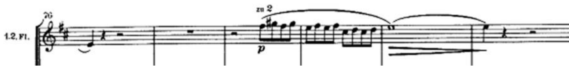
Motivo “tirili”, flautas (A2) (c. 78 a 81)

Aparece un nuevo elemento motivico en flauta (A2) derivado del mismo tema principal y relacionado con la descripción del canto de las aves; - motivo “Tirili” - (Almen. 2007)