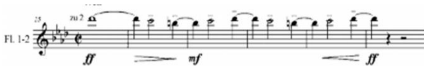
Motivo “Weh!”, Tutti (c. 25 a30)

Mahler emplea una nueva cita musical dentro de la introducción, esta vez de su propia autoría; es de Das Klagende Lied , material que originalmente acompaña al texto Weh! (W) (dolor, aflicción, pena).