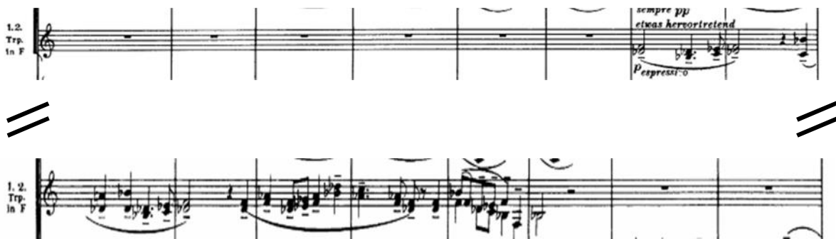
Lamento en trompetas. (c. 124 a 130)

Esta sección funciona como una gran recapitulación comprimida de los temas principales de la Parte A. Luego de la cadencia en Sol menor del “trío”, aparece directamente la tonalidad Mi bemol menor, resurge el ostinato en timpani y cuerdas graves, se retoma el canon al igual que el motivo de la burla en clarinete requinto (c. 118) y oboe + violines (c. 120). La sonoridad vuelve a ser densa y oscura. Dentro de este ambiente pesado y grotesco comienza a surgir un extraño lamento en trompetas (nuevamente con un matiz bastante Yiddish):