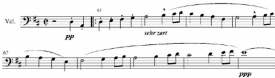
Tema en Chelos (A1) (c. 63 a 70)