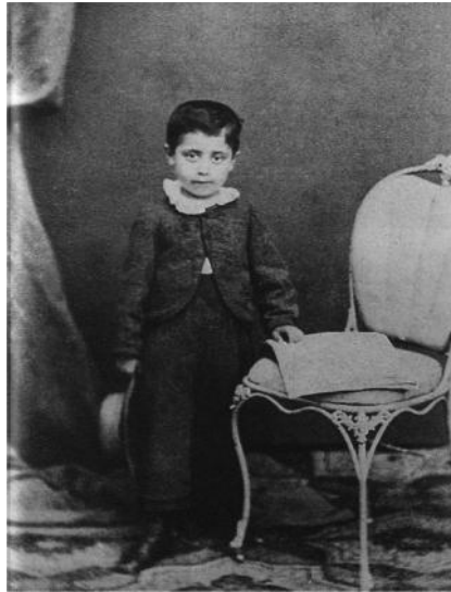
Gustav Mahler (1866)

Una vez instalados en Jihlava, Bernhard abre una destilería y una taberna, y es precisamente allí donde Mahler establece contacto con las canciones populares, la música de baile, las fanfarrias y toques militares del cuartel cercano. La relación con estos géneros musicales será otro factor evidente en toda su producción musical.