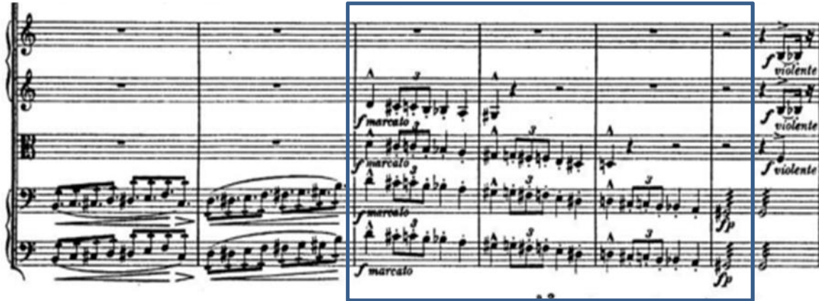
Liszt, Tresillos “infernales”, Sinfonía Dante (primer Movimiento “Inferno”)

Mahler emplea una nueva cita musical dentro de la introducción, esta vez de su propia autoría; es de Das Klagende Lied , material que originalmente acompaña al texto Weh! (W) (dolor, aflicción, pena).