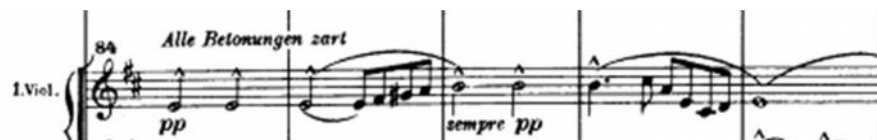
Tercer elemento motivico, violines 1 (A3) (c. 84 a 92)

El tercer elemento motivico del tema principal (A3) aparece en violines en el compás 84.