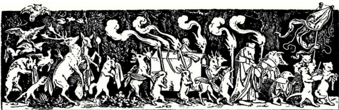
Moritz von Schwind (1804-1871), Grabado "Wie die Thiere den Jäger begraben" (Como los animales entierran al cazador)

Nº de compases: 168 Forma: Tripartita con "trío" (A B A') Tonalidad general: Re menor