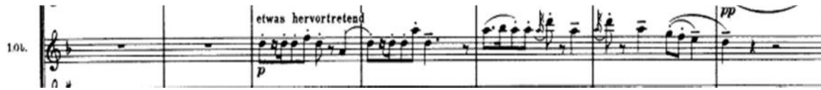
Tema de "la burla", Oboe 1 (c. 19 a 23)

En el compás 19, el oboe irrumpe con un tema de carácter burlesco, a manera de ridiculización de la escena trágica que se observa.