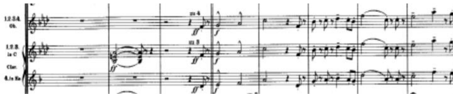
Inicio del tema principal (A), (c. 55 a 85)

Luego de la amplia inestabilidad creada durante la introducción, Fa menor es alcanzado en el 2º pulso del compás 54 (tiempo débil), produciendo una resolución ambigua que prolonga la sensación de “angustia” planteada por el programa. Surge entonces el tema principal (A) que se mantiene en el área tonal de Fa menor y que posee un carácter marcial, un tanto agresivo y angustioso. Este tema puede ser dividido en tres motivos independientes de la siguiente manera: