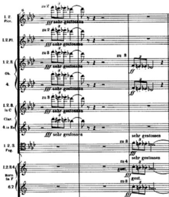
Mahler, Tresillos “infernales” (Tr), primera aparición en maderas (c. 8)

Los tresillos “infernales” son otra cita musical que Mahler toma de la “Sinfonía Dante”