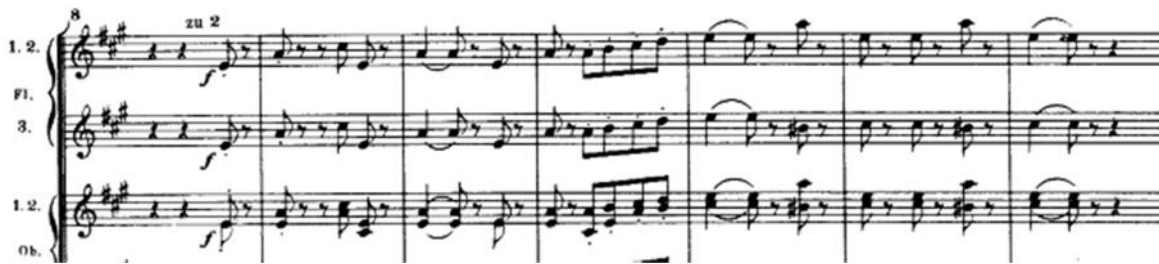
Tema principal del Ländler. Maderas (c. 9 a 14)

El tema principal del Ländler es expuesto por las maderas luego de 8 compases de introducción. Cabe anotar que tanto el motivo de acompañamiento como el tema principal retoman el intervalo de cuarta justa.