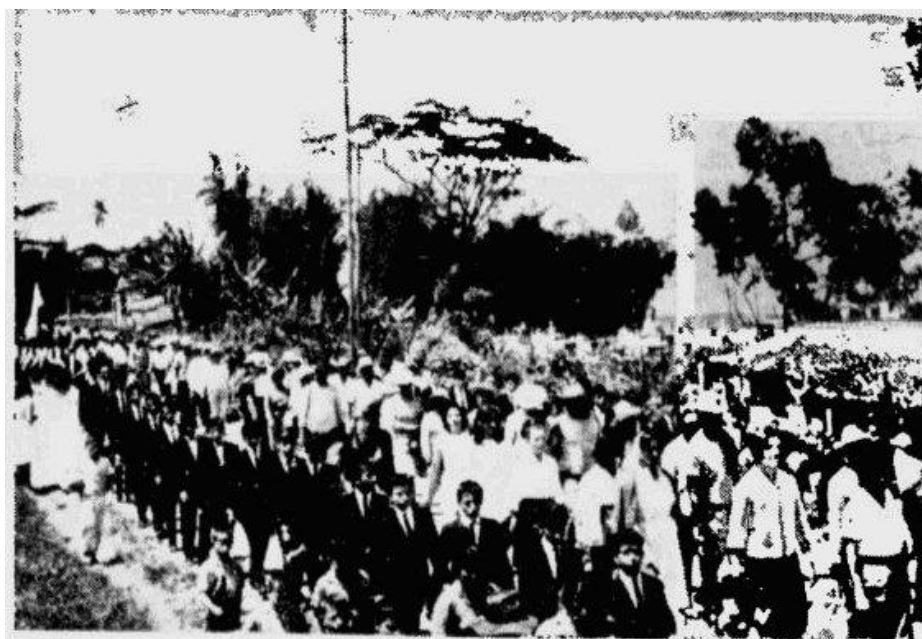
AL SALIR DE LA POBLACION DE SUAITA, Santander, la caravana de maestros caminantes fue despedida por miles de ciudadanos y por estudiantes, que marcharon a su lado durante varias cuadras. Ayer arribaron a Barbosa, después de haber pisado territorio de Boyacá y regresar luego a Santander. El tramo que recorrieron, aunque corto, puede considerarse como el más difícil de la marcha, por el mal estado de la vía.

Carta de estudiantes del Instituto Nacional Simón Araújo de Sincelejo al presidente de la República emitida el 20 de octubre “ante la imposibilidad de ver cristalizadas las más aspiraciones se ven obligados a tomar resoluciones como la asumidas por los educadores del Departamento del Magdalena en una marcha a pie a Bogotá, que el país entero conoce como la marcha de hambre, suceso paradójico en pleno Gobierno de su excelencia, concebido dentro de sólidos principios de transformación. El estudiantado colombiano y en particular el estudiantado del Instituto Nacional Simón Araújo ruega a usted brindar solución rápida y consecuente al tremendo drama de los maestros del Magdalena” 88