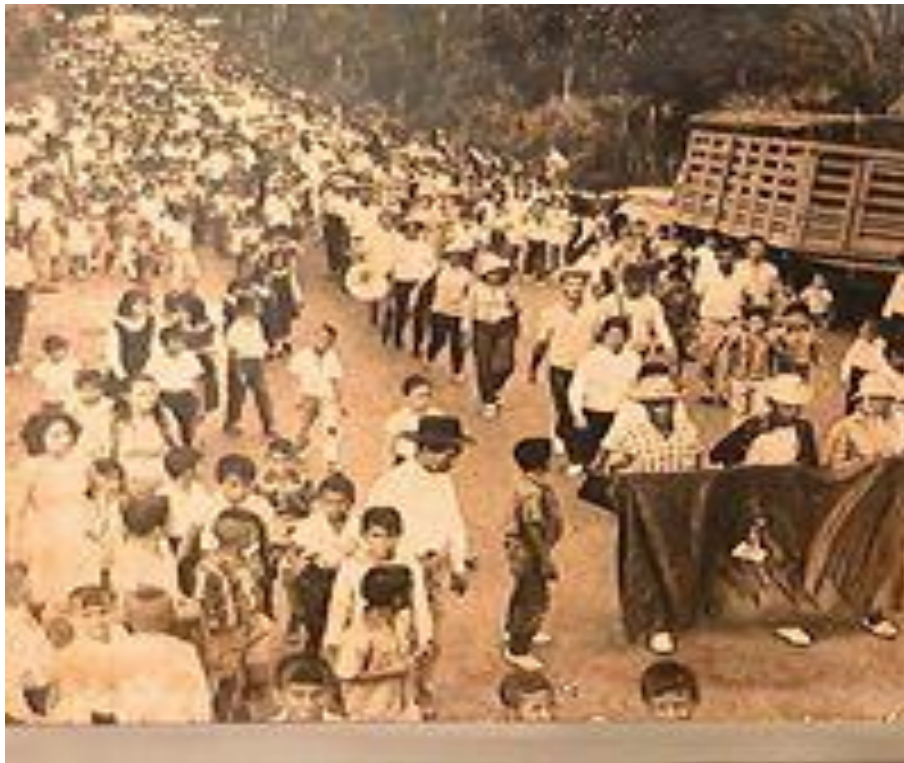
Imagen 4. Archivo de EDUMAG, Carpeta de Fotos, Marcha del Hambre folio 1