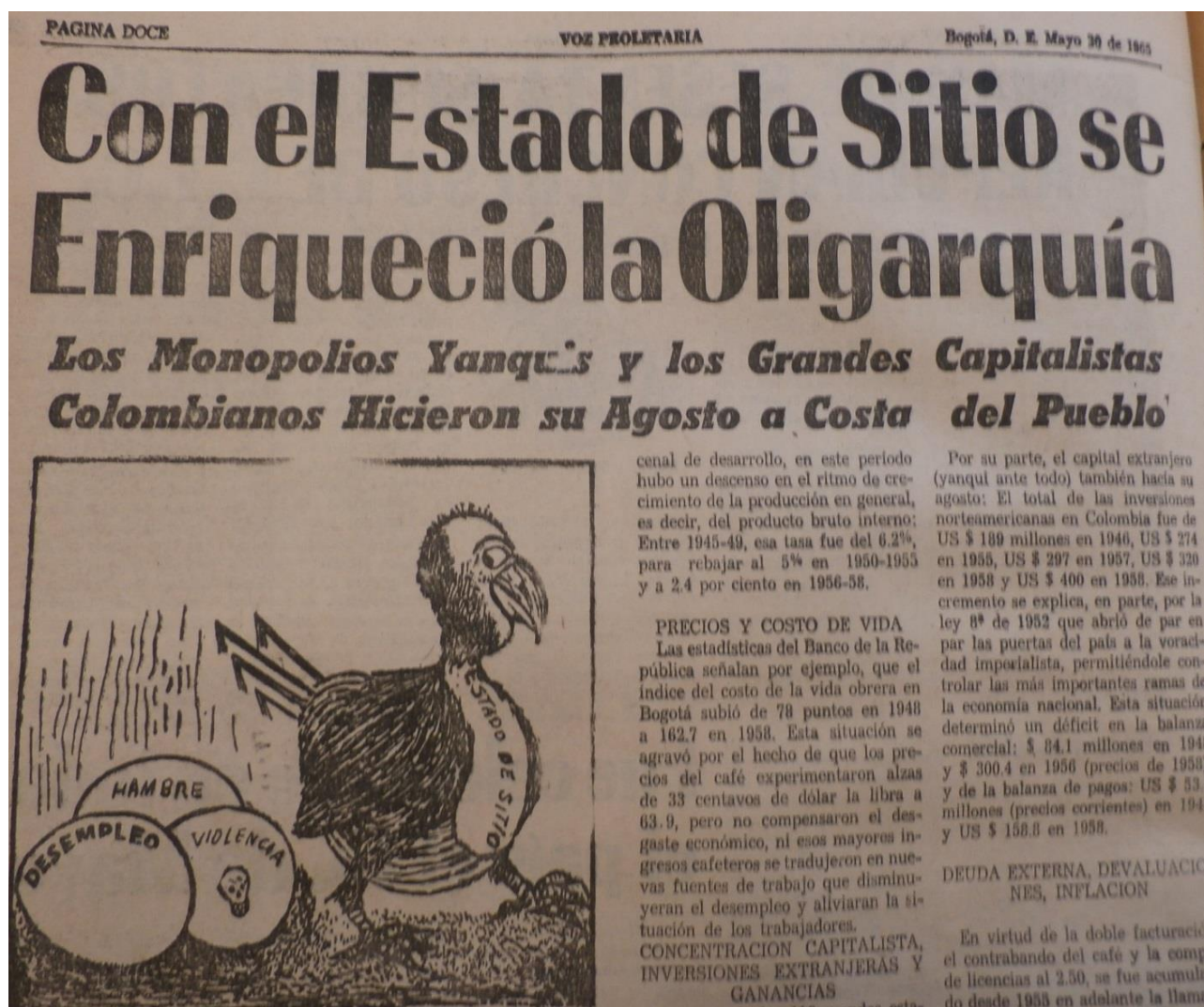
Imagen 1. "con el Estado de Sitio se Enriqueció la Oligarquía"