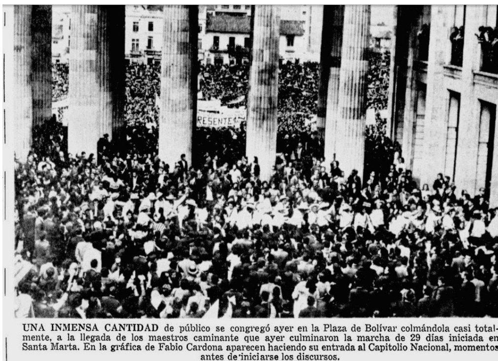
Imagen 3. Periódico el Tiempo. “Habrà Estatuto del Maestro. Octubre 22 de 1966. P. 1

Ciertamente la Marcha del Hambre ocupó un lugar preponderante en la cronología colombiana al posicionarse como la protesta social que más allá de constituir al Magisterio colombiano, representó a la sociedad, despertó la aceptación y solidaridad de diferentes sectores sociales. Además, la Marcha del Hambre es el punto de arranque para el activismo del Magisterio, donde las posteriores marchas, protestas y paros impulsaron las reivindicaciones y conquistas adquiridas después, como causales de las reclamaciones de la Marcha del Hambre.