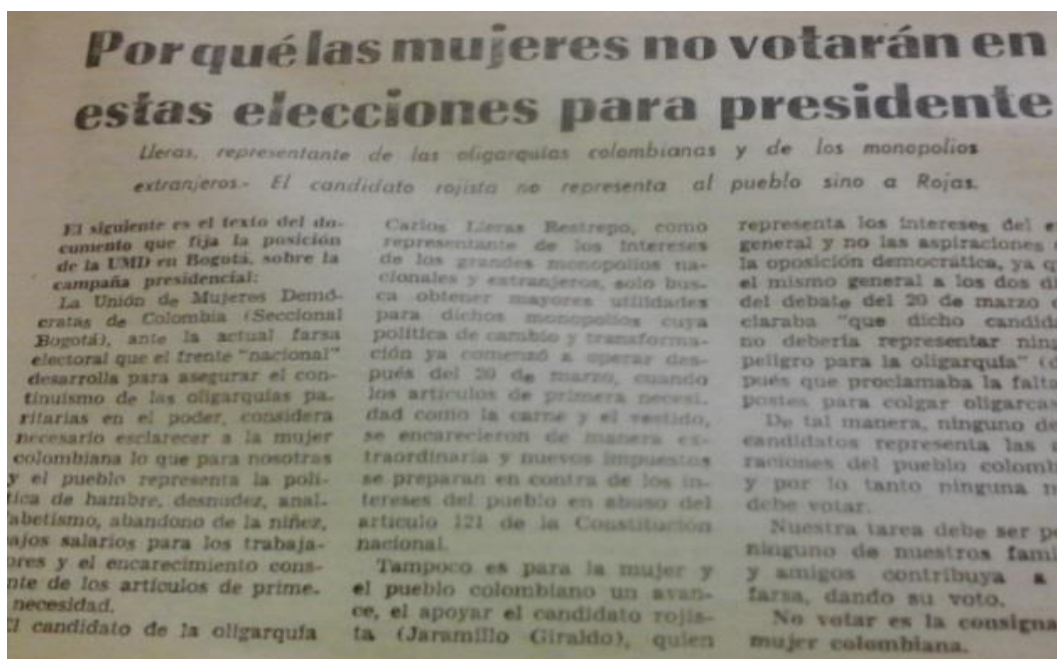
Imagen 8. Por qué las mujeres no votarán en estas elecciones para presidente.

autoras, tuvieron gran caudal electoral por la representación que tenían las mujeres en la política y el Gobierno.