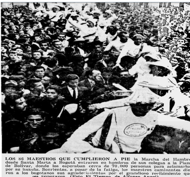
Imagen 6. Periódico el Tiempo. “manifestación frente al Congreso” octubre 22 de 1966. P. 25