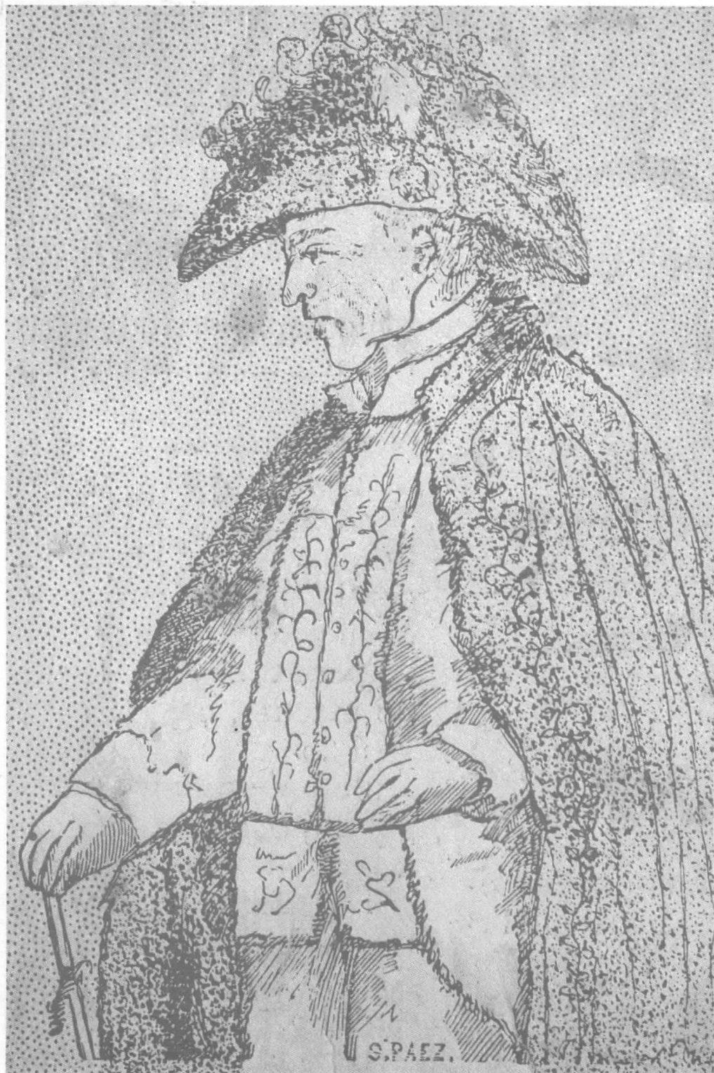
JUAN SAMANO Y URIBARRI, mariscal de campo y virrey del Nuevo Reino de Granada, grabado sobre papel. S. Páez, s.f., 9.7 × 13.0 cms. Museo Nacional. Colcultura, Bogotá.