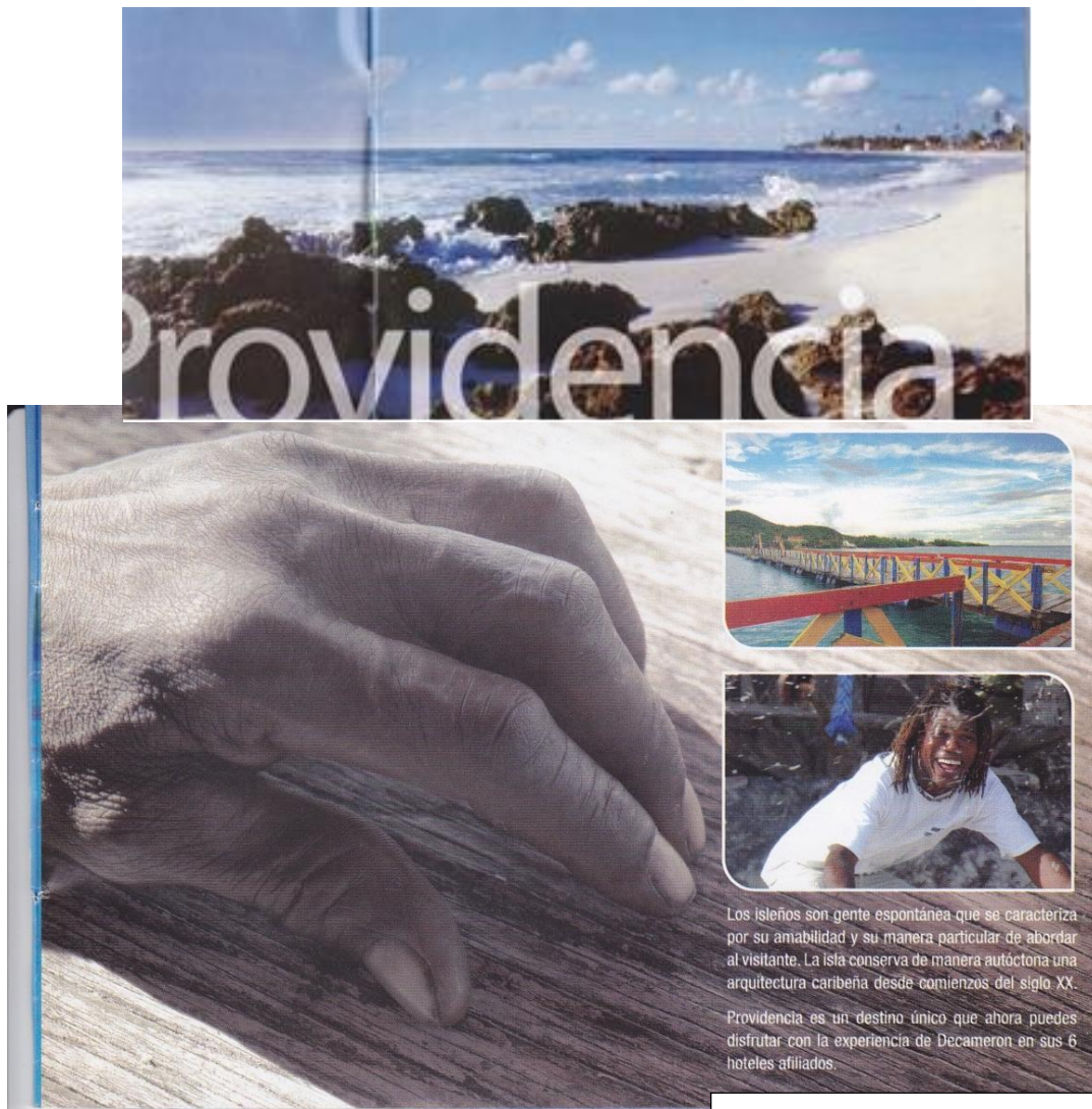
Imagen 1 y 2 Fragmento publicitario del año 2009 de la cadena hotelera Decameron

En la publicidad hotelera de las islas, Providencia es mostrada como un paraíso por sus recursos naturales, pero también se estereotipa la imagen del nativo como que “se caracteriza por su amabilidad y su manera particular de abordar al visitante”. Por otra parte, y tal como será descrito por los actores sujetos de investigación, este capital ambiental es el que le genera acceso al turismo como medio productivo, el tipo de personas que acceden a un viaje costoso y distante van por esa razón, si buscaran otro tipo de turismo y Providencia fuera igual que otras ciudades del Caribe, probablemente no pagarían un viaje tan lejano por algo que pueden encontrar a mitad de precio en otro lugar. Pero hay que tener en cuenta que si bien la manera de publicitar el destino turístico es desde su riqueza ambiental, el discurso estereotipado del “nativo” es naturalizante y problemático por las implicaciones ideológicas que tiene. Termina por ser una forma