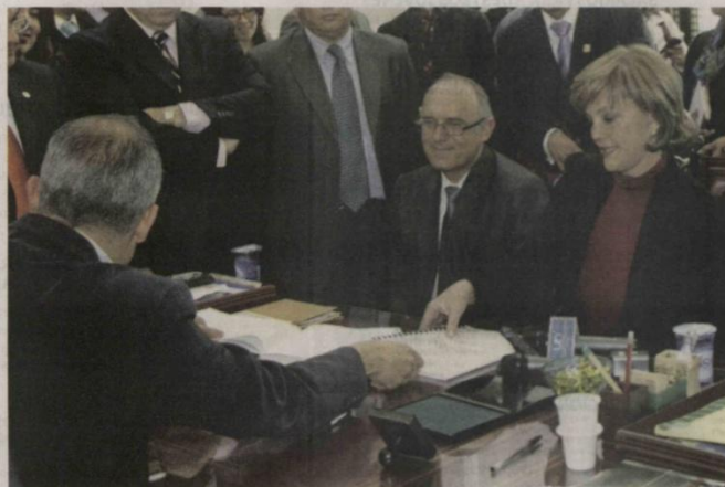
María Fernanda Campo, Ministra de Educación, en la radicación del proyecto de reforma a la educación, en la Cámara.

cesario que Colombia tenga su sistema educativo a tono con las grandes demandas, "un recurso humano cada vez más formado, más capacitado en un mundo más