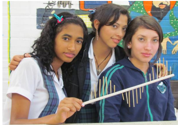
Luz linealmente polarizada