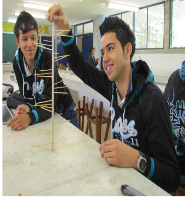
Luz circularmente polarizada