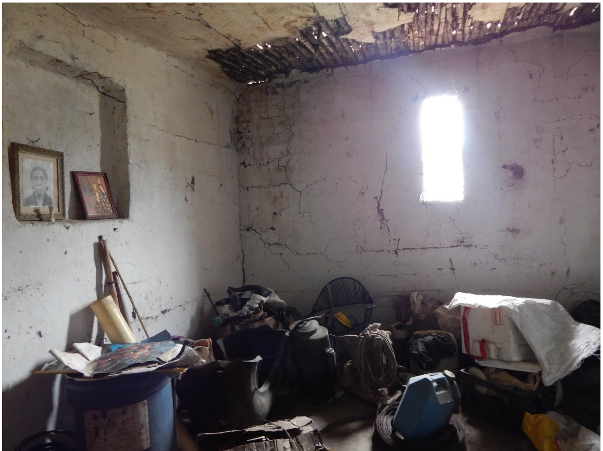
Fotografía 2: Cuarto abandonado de la abuela, Itaiibe Cauca Colombia, Abril 2018, María Alejandra Valencia.