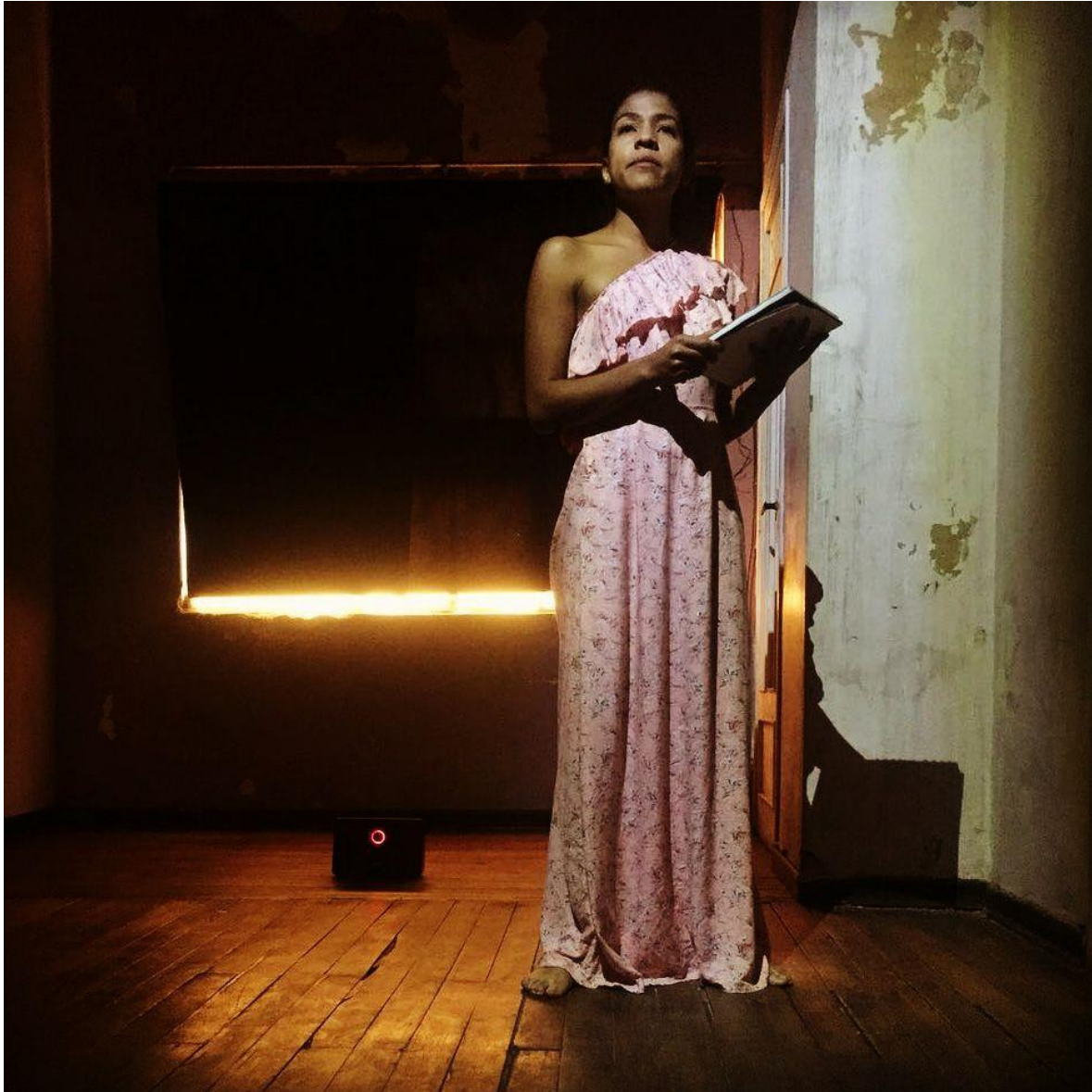
Fotografía 9: “Voces Heredadas” , primera presentación, Casa Taller Bogotá, 14 de Abril 2018, tomada por Alejandra Díaz.