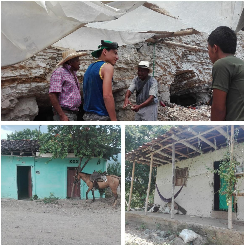
Fotografía 5: Itaibe 1, Mina de Fosforita, mi padre y mi tío, Casas de los abuelos, Itaibe Cauca, Abril del 2018, María Alejandra Valencia.