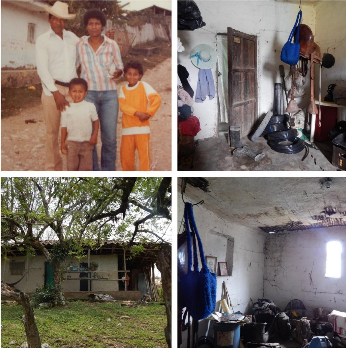
Fotografía 6. Itaibe 2, mi Tío y su familia, Cuarto abandonado de mi abuela- Casa materna, Abril 2018, María Alejandra Valencia.