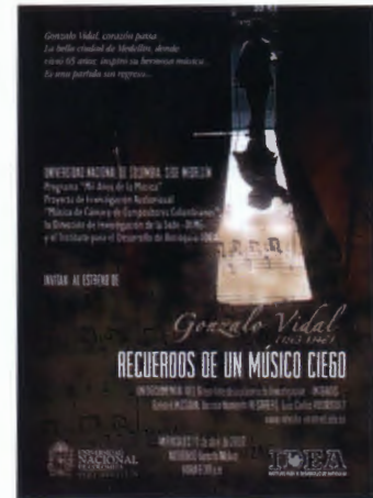
Figura 4.3 Recuerdos de un músico ciego

International Biographical Documentary en el New York International Independent Film & Video Festival, Nueva York y Los Ángeles (Estados Unidos), 2009; Bronze Palm Award (Documentary – International) del México International Film Festival, Rosarito (México), 2010; Premio Nacional de Periodismo Simón Bolívar, “Fuera de Concurso” en la Categoría Mejor Emisión Cultural en Televisión, Bogotá, 2010 (véase documental en https://www.youtube.com/watch?v=fkdBkJV1sw8 ).