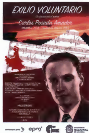
Figura 4.7 Exilio voluntario

Además de sus documentales, el Grupo INTERDÍS realizó una serie para televisión llamada “Historias musicales de Colombia”: quince capítulos musicales producidos a la manera de la legendaria serie llamada “Álbum musical del mundo” —programas de formato compacto de la NHK, la prestigiosa Corporación Radiodifusora de Japón— que en los años 1980 y 1990 se emitió en varios canales estatales de Hispanoamérica. Cada capítulo, de aproximadamente cinco minutos, presenta una pieza de música, con imágenes de paisajes y subtítulos en los que se narra la historia del compositor y de la respectiva pieza. En un solo fragmento televisivo se emiten tres mensajes en lenguajes diferentes: el sonoro (o musical), el visual y el literario.