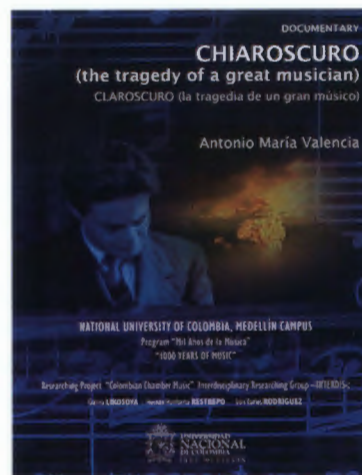
Figura 4.1 Claroscuro: la tragedia de un gran músico