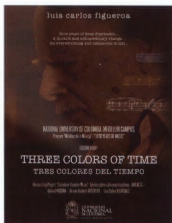
Figura 4.5 Tres colores del tiempo

Tres colores del tiempo , acerca del pianista, pedagogo, director y compositor caleño Luis Carlos Figueroa Sierra (1923). Se realizó entre 2001 y 2009, e incluyó trabajo de campo en las ciudades de Medellín, Cali, Popayán, Bogotá, París y Siena (Italia). Recibió el Bronze Palm Award (Documentary – International), del México International Film Festival, Rosarito (México), 2012 (véase documental en https://www.youtube.com/v1sQw962xHQ ).