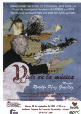
Figura 4.6 Vivir en la música

Vivir en la música , realizado entre 2008 y 2013, relativo al maestro Rodolfo Pérez González (Medellín, 1929), director de coros, pedagogo musical, investigador, transcriptor, compositor, organizador de eventos, hombre de radio e historiador musical. Con trabajo de campo en las ciudades de Medellín, Bogotá, Madrid, Palencia, Plasencia, Toledo y La Mancha (España). Este documental ha obtenido los siguientes reconocimientos internacionales: Silver Palm Award en el México International Film Festival 2013, y Best Film/Video in the Fine Arts Discipline en el XXVIII Black International Cinema, Berlín (Alemania), 2013, y Best Spanish Language Film en el Sunscreen Film Festival, South Bay, Los Ángeles (Estados Unidos), 2013 (véase tráiler en https://www.youtube.com/watch?v=s4lCg0aoav0 ).