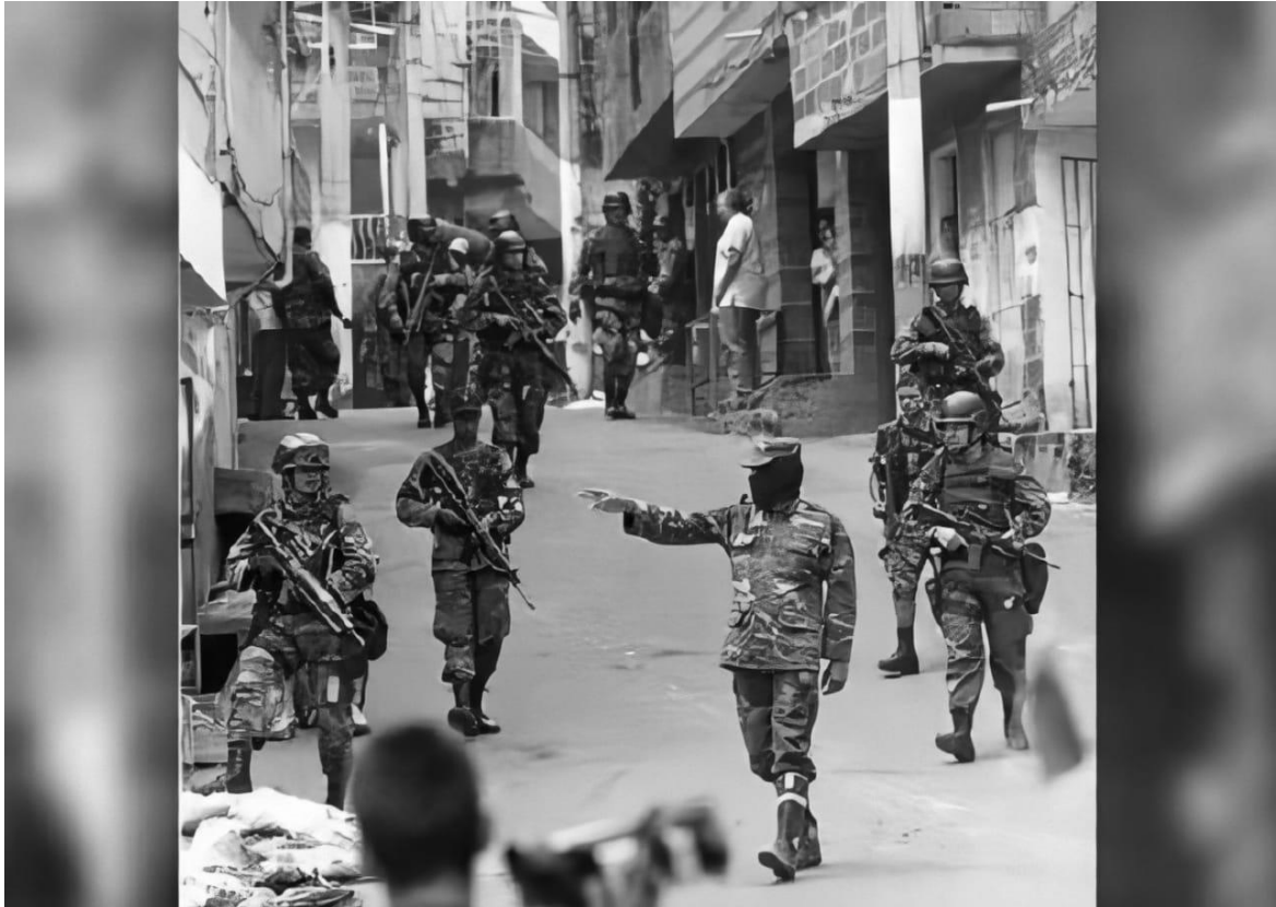
Figura 2-1: Una fotografía revela la verdad

La nitidez de la fotografía fue mejorada con la aplicación Remini.