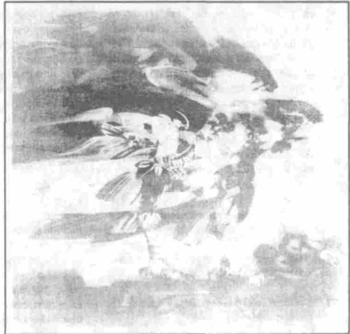
"Aguila azul". Acrílico sobre lienzo 175 x 170 cms., 1982.

política. Pero las superestructuras obran sobre la base de forma que los hechos económicos sufren profundamente la influencia de los demás elementos de la realidad social, en su movimiento dialéctico, en su perpetuo devenir, fuera del cual ella no existe. La integración total de la historia en la sociología es un principio fundamental del marxismo". ( Métodos de las Ciencias Sociales , Ariel, Barcelona, 1962, p. 31.).