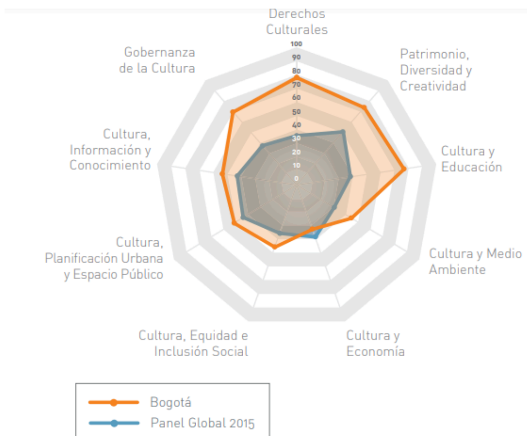
Figura 2.

participado como Ciudad Líder de la Agenda 21 de la Cultura, lo que implica un compromiso adicional con la evaluación y mejora continua de sus políticas culturales.